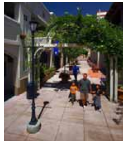
La facilidad para caminar en el centro está mejorada por el paseo cerca del Centro de Estacionamiento Todos Santos

El distrito de paisajismo fue establecido en 1983. Las evaluaciones se incrementaron por última vez hace 10 años. Como resultado, el distrito estaría operando con un déficit en el año 2009-10 si no se hubieran tomado medidas para financiar plenamente el distrito. La Ciudad y los residentes de Concord agradecen a los propietarios del centro por el apoyo al avalúo más alto y por garantizar que la comunidad continuará disfrutando la apariencia distintiva del centro.