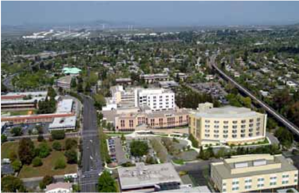
Esta presentación del plano del arquitecto del Centro Médico John Muir muestra los nuevos edificios a la derecha que son parte del proyecto de expansión de $170 millones