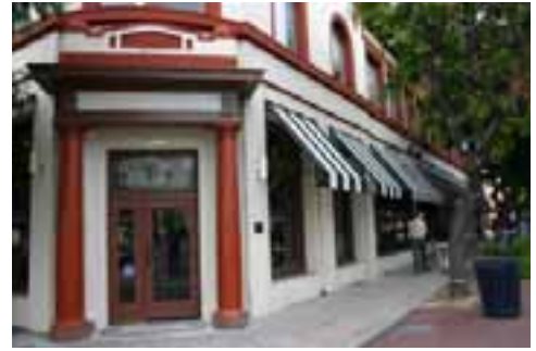
Después de una renovación mayor, Skipolini's Pizza abrió en el edificio histórico Foscett and Elworthy

La participación de la Ciudad en la renovación de la Plaza de Salvio Pacheco en Salvio Street fue crucial para el exitoso programa de nuevos inquilinos, trayendo a EJ Phair Brewery, Bloom Fusion, Panama Bay Café, Toscana Restaurant, y House of Bagels al centro de Concord. Este proyecto estimuló a un propietario anexo para iniciar un segundo proyecto mayor de renovación en Mt. Diablo Street – “Tiendas en Todos Santos” – en el cual Peets Coffee y Sway, una boutique especializada para damas, son