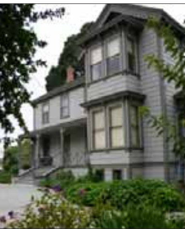
Casa Galindo y Jardines

La comisión ha revisado y aprobado muchos proyectos significativos en el período de 75 años desde 1931 hasta el 2006. Los Comisionados de Planificación, como todos los demás miembros de juntas y comisiones de la Ciudad son voluntarios que donan su tiempo y experiencia para el mayor bien de la comunidad.