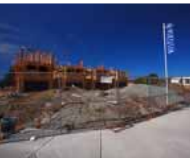
Nuevos proyectos residenciales en el centro incluyen (de arriba a abajo) Centre Point, Renaissance Square y Wisteria

99% de los participantes pre-escolares y 93% de los participantes en las clases recreativas calificaron los programas como buenos o excelentes.