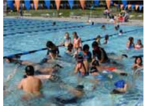
Los niños juegan en el agua en la Fiesta de Familia en la Piscina, un evento de Ningún Niño se Queda Adentro

El Equipo de Trabajo incluye funcionarios elegidos, representantes de la Cámara de Comercio de Concord Metropolitano, negocios pequeños, educación superior, el Distrito Escolar Unificado de Mt. Diablo, corporaciones, compañías de desechos sólidos y reciclaje, constructores de vivienda, servicios públicos, residentes y personal de la Ciudad. Los miembros del equipo se reúnen mensualmente y presentarán a la comunidad un informe final en Noviembre del 2007.