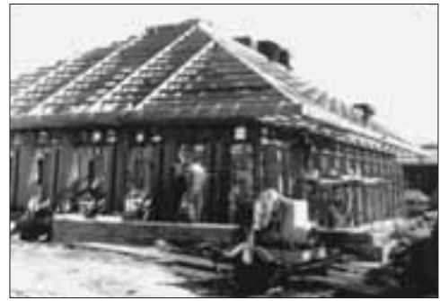
Cámaras de Concejo de la Ciudad en Civic Center en construcción, 1966 aprox.

En Diciembre de 2006, el Civic Center de Concord, ubicado en 1950 Parkside Drive,