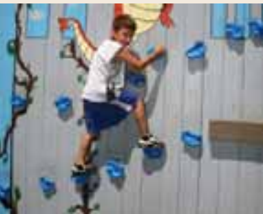
Arriba: El programa de salvavidas de la Ciudad recibió el Premio Internacional de Plata a la Seguridad Acuática