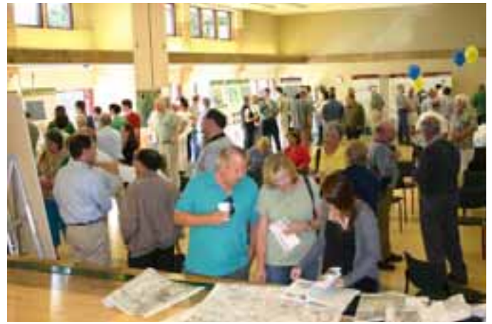
Un miembro del equipo del proyecto responde preguntas en el evento abierto Obtenga los Hechos el 17 de Marzo

El Departamento de Defensa seleccionó al Concejo de la Ciudad de Concord como la Autoridad Local para el Reuso (LRA) para elaborar un plan para el reuso civil de la propiedad. La Armada continuará siendo dueña de la propiedad hasta que se finalice el Plan de Reuso. El Concejo de la Ciudad trabajará de cerca con la comunidad, la Armada o Marina, y las agencias reglamentarias estatales y federales durante los próximos años para completar el Plan de Reuso de la Comunidad de Concord, y transferirá la propiedad de uso militar a uso civil.