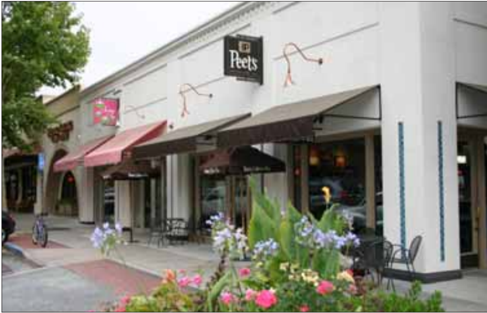
Las nuevas "Tiendas en Todos Santos" están ancladas por Peet's Coffee and Sway