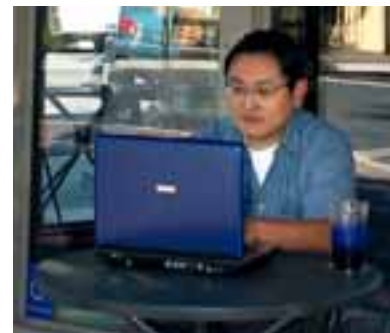
Ya se ofrece Wi-Fi gratis en muchas áreas de Concord

Primavera ..... 67 Verano ..... 86 Otoño ..... 76 Invierno ..... 60