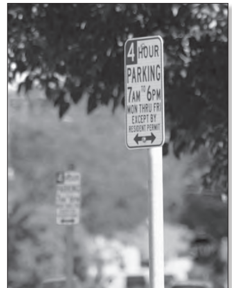
Las señales indican a los conductores que el tiempo de estacionarse es limitado en el vecindario cerca a la estación del BART de Concord en el Centro de la Ciudad a menos que el conductor tenga un permiso residencial para estacionarse.

La meta de los Servicios de Estacionamiento no es penalizar a los residentes, pero asegurar que todos los vehículos que están estacionados en las calles públicas cumplan con las regulaciones estatales y locales. Los residentes que vean vehículos estacionados de manera ilegal pueden contactar a los Servicios de Estacionamiento al (925) 671-3259. ♦