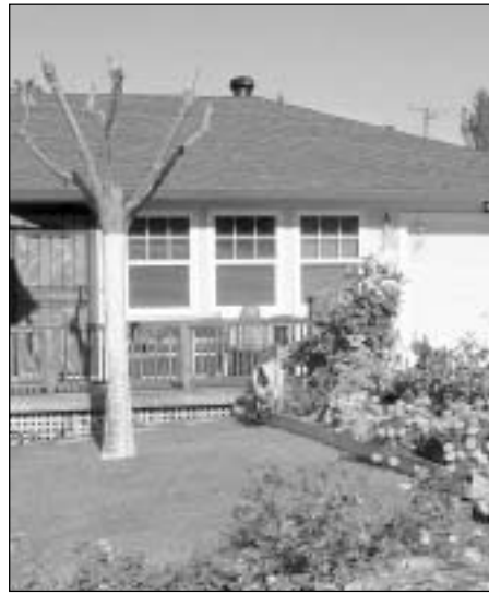
Los buenos vecinos se enorgullecen de sus hogares bien cuidados

En el ejemplar Verano 2003 de Noticias de la Ciudad de Concord, solicitamos a los propietarios de negocios y de residencias y a los inquilinos que se involucraran en el proceso de toma de decisiones y solución de problemas para ayudar a hacer la diferencia en nuestra comunidad. Se hicieron varias sugerencias sobre cómo involucrarse, incluyendo unirse a las Alianzas de Vecindarios y llamar a las líneas de atención de 24 horas para reportar problemas. Muchos se han unido a las Alianzas de Vecindarios y han llamado a las líneas de atención. Otros han dicho que no pueden asistir a las reuniones de las Alianzas, pero que desean involucrarse. Posiblemente la mejor manera en que todos pueden involucrarse es simplemente siendo un buen vecino de negocio o residencia.