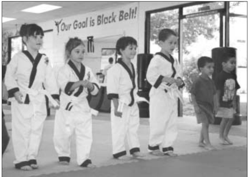
Entusiastas estudiantes de taekwondo hacen fila para una lección. Los jóvenes también encontrarán clases de ajedrez, danza tap, tambores, ballet, guitarra y muchas otras que se ofrecen en la Guía de Actividades de Invierno.

Este invierno se repite el programa de Snowboarding de los Ángeles Azules. Se proporciona transporte en autobús de lujo a Sierra en Tahoe, orientación profesional, y supervisión por parte de adultos para que los jóvenes puedan