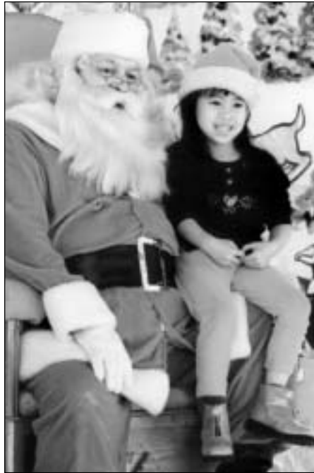
Una niña charla con Santa en el evento de La Gran Llegada de Santa en la Plaza de Todos los Santos. Este año el evento tendrá lugar el sábado, 13 de diciembre.

El centro se ilumina para las fiestas con el programa Cantemos Todos Junto al Alcalde y la iluminación oficial del Árbol de las Fiestas el sábado 6 de diciembre en la tarde, en la Plaza Todos los Santos, Willow Pass Road con Grant Street en el centro de Concord. El evento gratuito se inicia a las 5 p.m. con entretenimiento festivo en el escenario de Todos los Santos. El Alcalde liderará el canto de villancicos tradicionales antes del gran final, cuando se ilumina el árbol oficial de las fiestas con cientos de focos brillantes. Hay suficiente estacionamiento gratuito en los garajes municipales en las calles Salvio y Grant, o Salvio y Concord Avenue. Para mayor información, contacte a la Coordinadora del Centro, Florence Weiss, 671-3403.